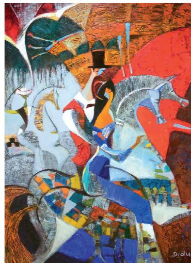
Всадники, холст/акрил, 120x90

Родилась в Харькове. Окончила Харьковское художественное училище (1978-1982) и позже Харьковский художественно-промышленный институт, отделение «Монументально-декоративная живопись» (1984-1989). В 1994 иммигрировала в Израиль. Работала в дизайне интерьеров: спроектировала купол в отеле Малкат-Шва (Эйлат), сотрудничала с галереями. Многократный участник выставок: «Арт-экспо» (Нью-Йорк), Салон Пьера Кардена (Париж), «Арт-Капитал», Гран-Пале (Париж) и других. Работы находятся в музее МОРА (США) и в частных коллекциях Франции, США, Израиля, Швейцарии, России и Казахстана. С 2008 года – член французской ассоциации «Стелла Арт Интернешнл».