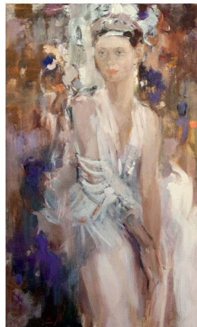
Девушка в белом холст/масло, 70x120

Является членом французской ассоциации «Стелла Арт Интернешнл».