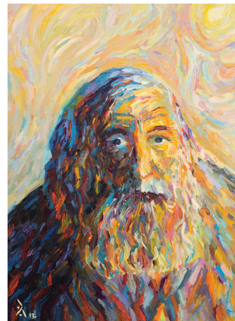
Старик, холст/масло, 70x60

В 2015 году в составе группы российских художников удостоена Гран-при 7-го Парижского Салона современного искусства Business Art, проходившего в Центре Пьера Кардена.