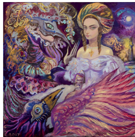
Фантазия, холст/масло, 100x100

Работает в фигуративном, поэтическом, сказочном стиле. Ее картины наполнены внутренним светом, фантазмагоричны и переносят зрителя в мир детских грёз, в волшебные края фантазий и иллюзий. Худож-