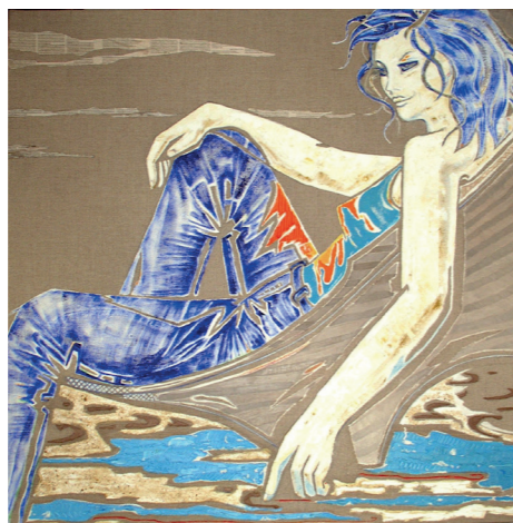
Цвет моря холст/масло, 100x100

Является почетным академиком Российской академии художеств.