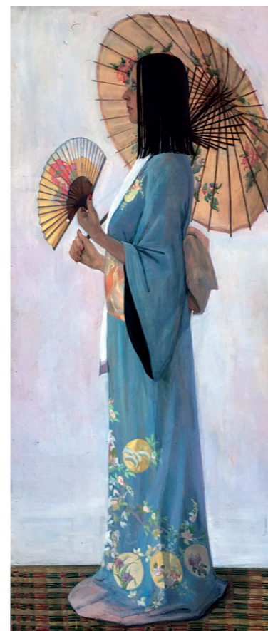
Японка, оргалит/акрил, 60x140

Является членом французской ассоциации «Стелла Арт Интернешнл».