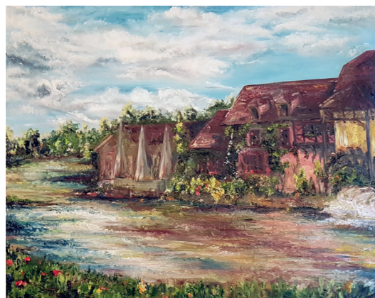
Мельница в городе Фурж холст/масло, 100x80

Родилась в 1982 году в городе Сергиев-Посад Московской области. Рисованием увлеклась с детства, закончила художественную студию, училась музыке. Но после школы пошла не на творческую специальность: получила диплом финансиста, второе высшее образование юриста-международника, защитила кандидатскую диссертацию на стыке двух специальностей: менеджмента и финансов. Тем не менее, любовь к живописи и творческому самовыражению сопровождали весь жизненный путь, стали частью личностного развития. В настоящее время работает в представительстве Россотрудничества во Франции и активно выставляется на престижных площадках во Франции, России, Бельгии и других странах. Любит экспериментировать с разными материалами: карандаш, гуашь, масло, акрил, тушь.