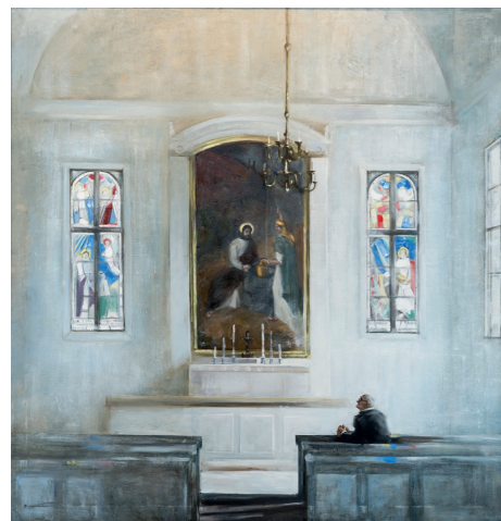
Молитва холст/масло, 110 x 105