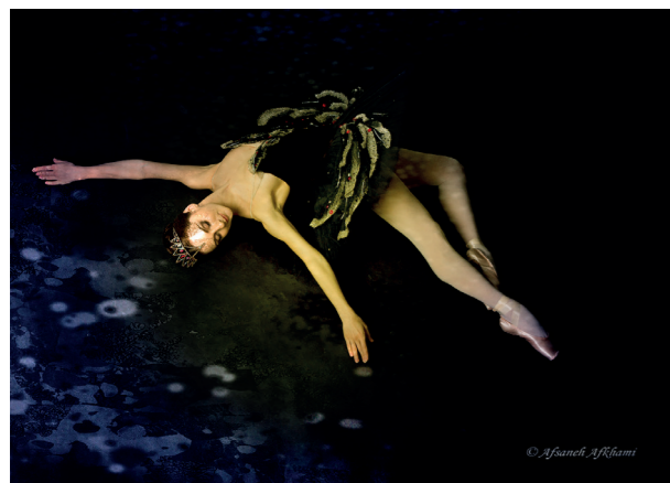
Балерина Большого театра Диана Козырева, фотопортрет, 110x70

«Моя цель...? Уловить мимолетное мгновение каждым новым нажатием кнопки камеры, предоставляя уникальную возможность передать правдивый и эмоциональный момент через вневременный взгляд художника».