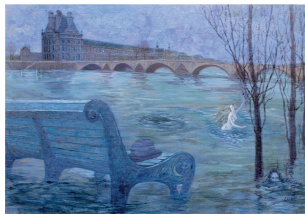
Ночь парижских сирен холст/масло, 130x90

«Арт-Капитал», Гран Пале; ассоциация «Российско-французский диалог»; выставочные залы собора Мадлен (Париж); замок Борегар; Салон Верхней Луары (Пюи ан Велз, Франция); «Сполетто Европ Арт» (Сполетто); Vox Animae, (Милан, Италия); Российский культурный центр (Брюссель, Бельгия); Российская неделя искусств (Москва).