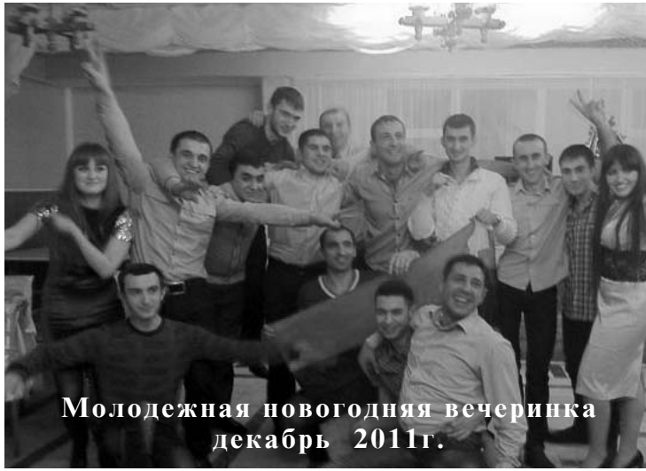
Молодежная новогодняя вечеринка декабрь 2011г.

Театр Армении - наряду с греческим и римским - один из древнейших театров мира европейского типа. В 301 году после принятия христианства, театр в Армении был запрещен. В средние века театр существовал в виде цирка, народных игр и духовной драмы.