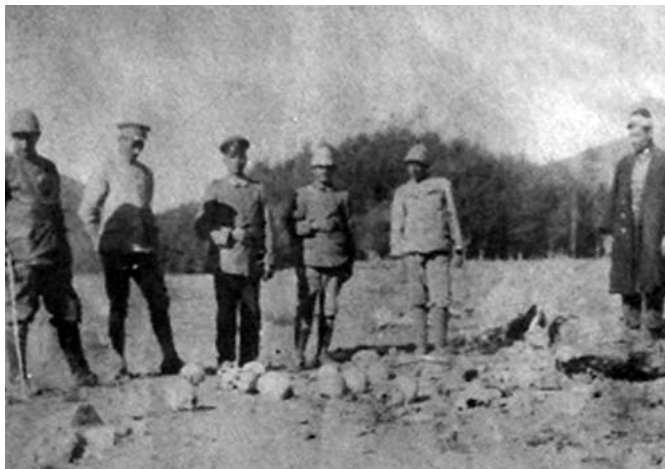
Немецкие и турецкие солдаты фотографируют череп армянских жертв

Оно осуществлялось при трех разных и враждебных режимах с помощью армии, полиции, жандармерии и "Специальной организации" (Тешкилати махсуссе), созданной для этой цели по инициативе Центрального комитета правившей партии "Единение и прогресс" совместно с военным ведомством. Массовая резня, надругательства над святынями, убийства детей, тысячи преступлений против человечества осуществлялись турками на протяжении многих лет, которые остались безнаказанными. До сих пор армянский народ не может оправиться от ран, нанесенных турками. Политика по