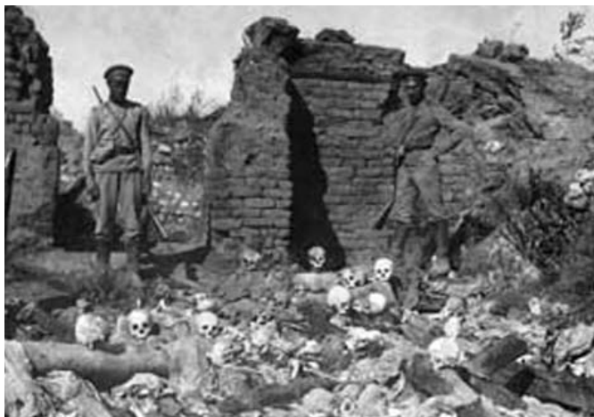
Заживо сожженные турецкими войсками армяне в селе Шейхалап, 1915 год

Геноцид армян - первое в новой истории человечества широкомасштабное международное преступление, совершенное с целью уничтожения целого народа по политическим мотивам. Организатором этого преступления было турецкое правительство. Геноцид осуществлялся с применением физического уничтожения и депортации, включая перемещение гражданского населения в условиях, приводящих к неминуемой смерти.