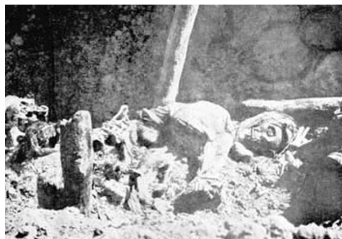
Скелеты замученных и убитых турками около монастыря в Мусе армянских женщин и детей

армянского народа на исторической родине - Западной Армении. Армяне до сих пор ждут справедливого решения этого вопроса и будут бороться до тех пор, пока не добьются правосудия над турками-палачами