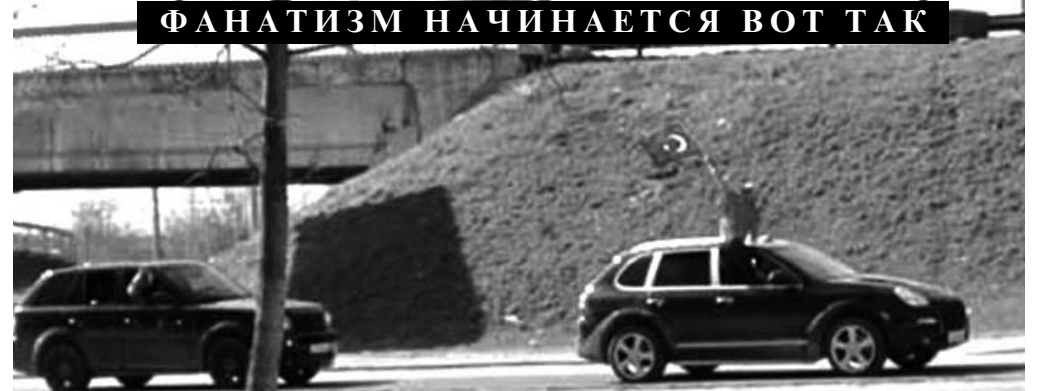
ФАНАТИЗМ НАЧИНАЕТСЯ ВОТ ТАК

Россия одна из первых стран, которая осудила события 1915 года. Еще 24 мая 1915 г. союзные державы - Англия, Франция и Россия - совместно выступили с заявлением, в котором впервые конкретно обвинили другое правительство в "преступлении против человечности". В этом совместном заявлении, в частности, отмечалось: