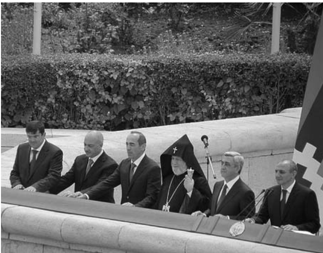
На площади возрождения столицы Нагорно-Карабахской Республики Степанакерт состоялся Парад Победы, посвященный 20-летию освобождения Шуши, формирования Армии обороны НКР и 67-летию Победы в Великой Отечественной войне.