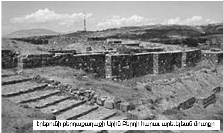
Երեւանի բերդաքաղաքի Արին Բերդի հարաւ արեւելեան մուտքը

Այն, որ ադրբեջանցիները պատրաստ են սեփականացնել ամեն հայկականը՝ պարը, երգը, մշակույթը, քաղաքը, վաղուց յայտնի է: Այս երեսույթի բուն պատճառները եւս առեղծուած չեն: Ադրբեջանցիները ազգութիւն՝ էթնոս չեն, չունեն մեզ՝ հայերիս նման հարուստ պատմութիւն եւ ինքնատիպ մշակույթ, ավելին՝ անգամ սեփական պատմական տարածքը չունեն, ուստի Ադրբեջանի կոռուպացված վարչակարգը հարկադրուած հակահայկական շեշտուած քաղաքականութիւն է վարում՝ սեփական բնակչութեանն ապացուցելու համար, որ հայերից ինչ-որ բան սեփականացնելն իրենց գերագոյն յաղթանակն է: