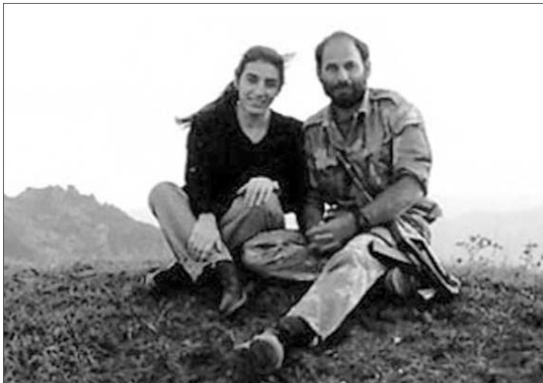
К дню рождению Героя